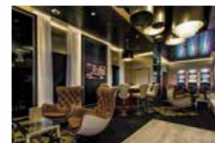
CASINO & LOUNGE (Deck 5 – Pier) Hier liegt ein wenig Monte Carlo in der Luft. Versuchen Sie in stilvoller Casino-atmosphäre Ihr Glück. Wir drücken Ihnen die Daumen.