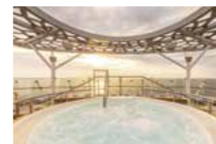
X-SONNENDECK (Deck 15 – Brise) Abschalten und Genießen in besonderem Ambiente für Gäste unserer Suiten und Junior Suiten: Erfrischung inklusive. Als besonderes Highlight können Sie hier ein Bad im Whirlpool genießen.