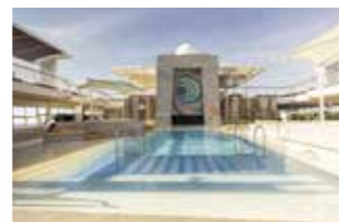
LAGUNE (Deck 12 – Aqua) Einfach mal treiben lassen und im kühlen Nass erfrischen.