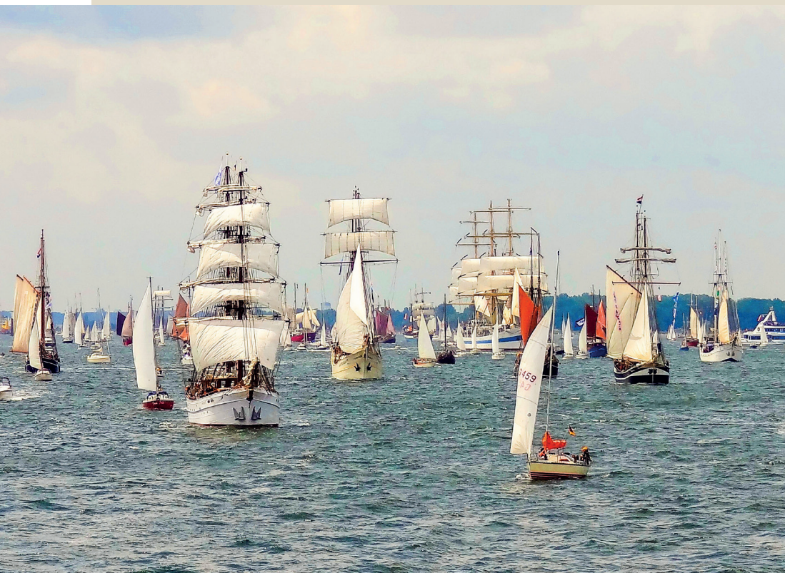
Segelregatta Kieler Woche, Blick auf die Förde. Sailing regatta Kiel Week, view of the fjord.